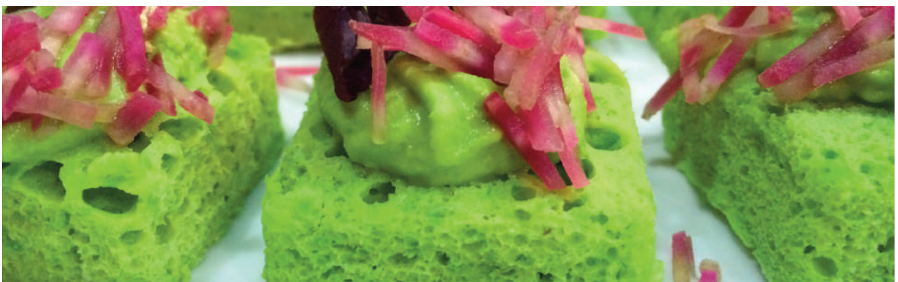
N'Bread - « Pain de légumes » à mi-chemin entre mousse fraîche de fruits ou légumes et mie de pain

A noter : en plus de la réglementation européenne, certains pays européens peuvent avoir des règles différentes concernant l'enrichissement. En outre, les règles d'étiquetages devront être adaptées aux règles de chacun des pays communautaires.